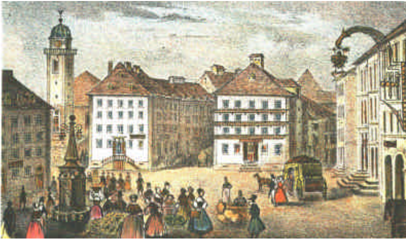
Fig. 1 Banque Robert (Collection Jacqueline et Pierre-Arnold Borel), 1998.

Paul il naît un 17 octobre 1822 et on le baptise le 30 novembre suivant. Il sera négociant.